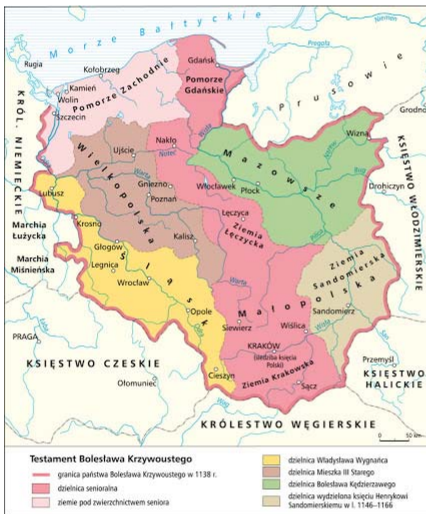
Административна територијална подела државе према замисли из тестаментa Болеслава Кривоустог (прва пол. XII века)

И најзад треће, да би осигурао јединство државе, донео је закон о наслеђивању власти после своје смрти познат као Ustawa sukcesyjna (Testament Krzywoustego) . Уместо да спречи распадање земље, овај законски акт довео је до 200-годишње феудалне расцепканости... Тестамент Кривоустог уводио је поделу власти међу његовим наследницима на помесне, удеоне кнежевине, чији би носиоци поштовали принцип сениората, старешинства у личности најстаријег, владара Кракова. Разуме се да се ово практично никад није поштовало.