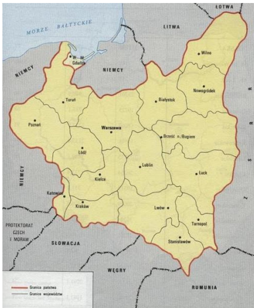
Пољска између два светска рата

Један од ултимативних захтева Адолфа Хитлера према Пољској уочи II св. рата био је слободан копнени пролаз ка Источној Пруској, а када је пољска дипломатија то покушала да одбије – десио се 1. септембар 1939! Па ипак, проблем ни до данас није решен: одредбама Потсдамске конференције 1945. Источна Пруска подељена је готово равним потезом лењира између Пољске и Совјетског Савеза. Северни део некадашње немачке територије административно је припао из необјашњивих разлога Руској Федерацији, тада чланици СССР. Распадом ове државне творевине, настао је нови парадокс: ексклава Русије стешњена између Литваније и Пољске – Калињинградска област РФ.